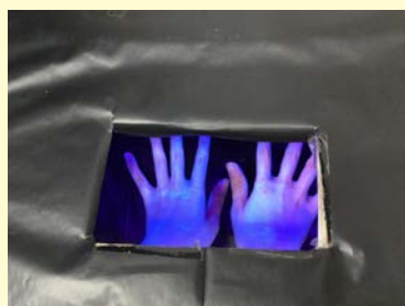
<ローション後、手洗い>

特に爪の周りや指の間、手の甲、手首などの汚れが目立っており、洗い残しの多い部分の確認をすることができました。患者様への関わり支援など、様々な場面において職員自身が感染の媒体者とならないために正しい手洗いの方法を身につけ、感染予防に努めていきたいと思えます。